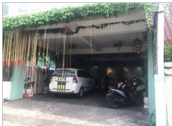
Gambar 4. Salon Andini