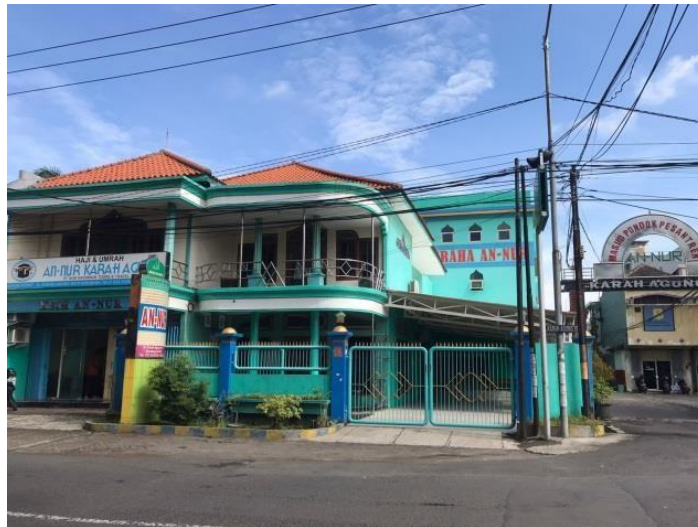
Gambar 6. Masjid PondokPesantren Graha An-Nur

Selanjutnya yang mengalami kesulitan menjalani bisnis di 2 tahun terakhir adalah Salon Andini. Salon ini adalah salon kecantikan yang berada di kawasan Karah Agung VI. Salon ini menjalankan treatment-treatmen untuk menjaga kecantikan wanita dan juga memiliki satu butik kecil yang berada tepet dihadapannya. Sejak 2 tahun terakhir ini Salon Andini mengalami penurunan pelanggan yang signifikan disbanding sebelum terjadinya wabah penyakit Covid-19 ini berlangsung di tahun 2019. Salah satunya adalah jarangya pelanggan yang datang sedangkan Salon harus terus beroperasi buka dengan pelanggan yang kadang tak menentu, mengurangi jumlah pegawai adalah salah satu upaya Salon Andini untuk mempertahankan usaha mereka. Pasca pandemi dan dan massa PPKM yang berlangsung 2 tahun terakhir ini, salon memiliki kekuatan kembali untuk melanjutkan usaha mereka yang sempat terhambat oleh pandemi di Indonesia.