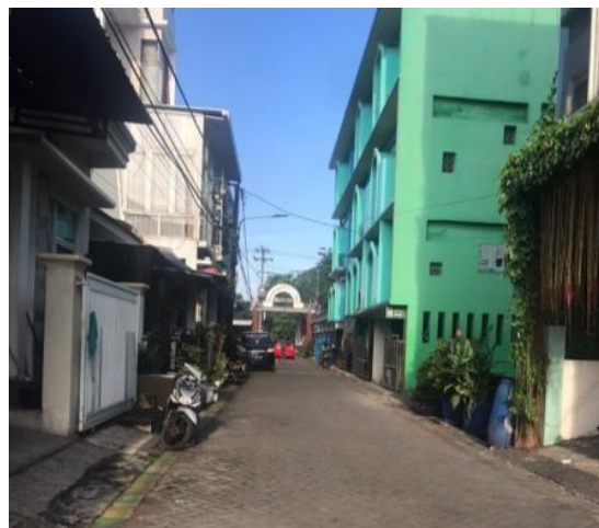
Gambar 5. Jalan permukimanKarah Agung VI

Salah satu yang menjadi korban dari berlangsungnya pandemi virus Covid- 19 adalah Pak Faisal sekeluarga. Biasanya mereka memiliki 2 toko untuk menjadi tempat penjualan plastic mereka satu di pasar karah dan satunya lagi di rumah yang dijadikan juga sebagai gudang. Akibatnya dari pandemi 2 tahun terakhir ini mengakibatkan Pak Faisal sekeluarga