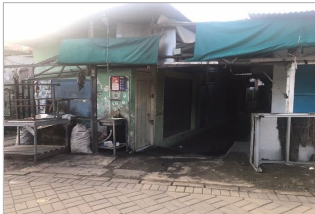
Gambar 3. Toko Bp. Faisal yang berada di Pasar Karah