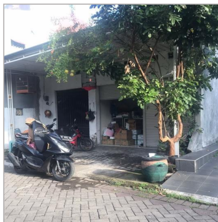
Gambar 2. Toko Bp. Faisal “Toko Plastik”

Tidak hanya toko Pak Faisal saja yang menjadi sebuah masalah utama dikeluarga ini, masalah lainnya adalah aktivitas sekeluarga Pak Faisal yang mengalami perubahan. Dua tahun terakhir ini menjadikan Pak Faisal dan sekeluarga menjadi orang-orang yang aktif melakukan kegiatan olahraga dan juga menjaga pola makan untuk hidup lebih sehat mengingat salah satu anggota keluarga pernah menjadi korban virus Covid-19 yang membuat anggota keluarga lain menjadi sangat aware dengan kesehatan mental dan fisik.