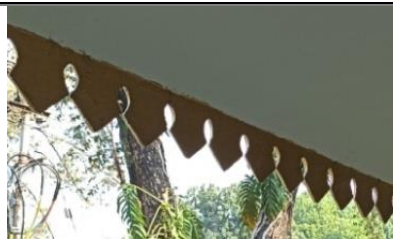
4 Konsol besi atap