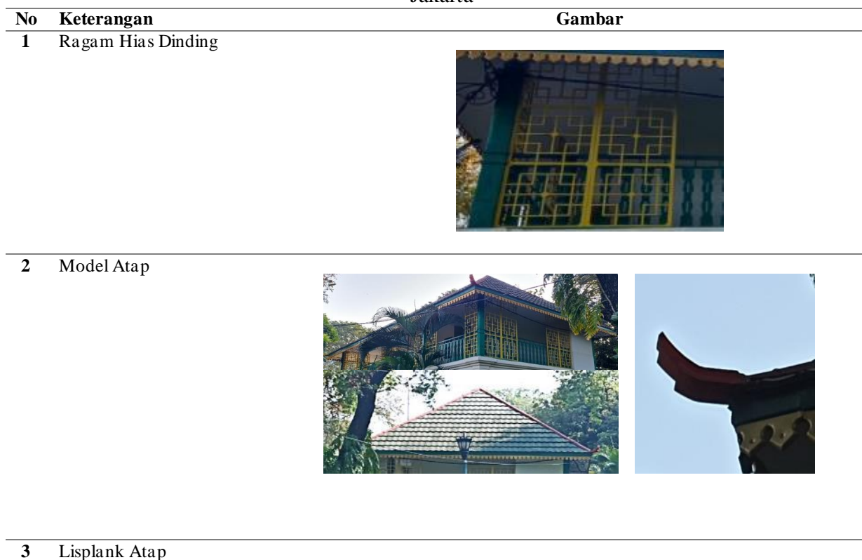
Tabel 1. Elemen Arsitektur yang ada di Musholla Babah Alun Taman Suropati Menteng Jakarta

Kajian ini mengambil tujuh elemen arsitektur yang diambil saat kunjungan lapangan ada di Musholla Babah Alun sebagai obyek sekaligus variabel penelitian. Ketujuh elemen tersebut adalah ragam hias dinding, model atap, lisplank atap, konsol besi atap, signage papan nama dan papan petunjuk tempat wudhu (Tabel 1).