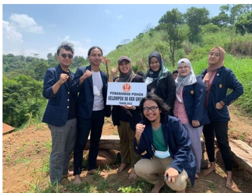
Gambar 6. Penanaman bibit pohon (dokumentasi pribadi)

(3) Bertani singkong seperti kebiasaan warga. Dalam paket wisata ini pengunjung dapat merasakan bertani singkong seperti kebiasaan sebagian warga di Cireundeu mulai dari menanam, menyiram, hingga memanen. Setelah itu pengunjung dapat melihat proses pengolahan singkong menjadi rasi dan produk lain seperti tepung kanji dan kue kering.