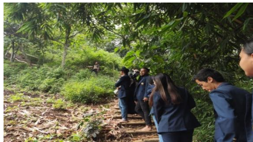
Gambar 4. Hiking menuju Puncak Salam

ketinggian 900 mdpl. Salah satu hal unik dari kegiatan ini adalah pengunjung harus mendaki tanpa menggunakan alas kaki, hal ini dilakukan untuk menghormati alam dan mengingatkan bahwa manusia terbuat dari tanah dan akan kembali lagi ke tanah. Pendakian ini memiliki jalur yang cukup landai tetapi dengan jarak yang cukup jauh. Selama menyusuri jalur ini pengunjung dapat mengamati hutan pertanian (Leuweung Baladahan) yang menjadi tempat ditanamnya pohon singkong juga terdapat kumpulan pohon bambu dan pepohonan lain yang kemungkinan adalah bagian dari Leuweung Tutupan (hutan reboisasi). Jalur ini kebanyakan terdiri dari susunan batu berukuran sedang dan dibatasi dengan batu yang lebih besar. Batu batu tersebut sebagian ada yang mengandung unsur magnet dan bila kandungan magnetnya tinggi dapat dimanfaatkan untuk pengobatan. Selain itu, jalur ini juga terdiri dari undakan tanah yang dibatasi bambu maupun undakan tanah biasa. Sepanjang jalur pendakian terdapat satu pos, berupa saung, yang bisa digunakan pengunjung yang ingin beristirahat di tengah pendakian. Tepat sebelum sampai di Puncak Salam terdapat hutan pinus yang rindang. Sesampainya di puncak terdapat satu saung yang dapat digunakan untuk beristirahat dan biasanya menjadi tempat untuk pemandu memainkan karinding sebagai bentuk persembahan kepada alam.