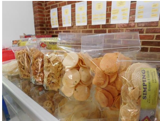
Gambar 7. Oleh-oleh Kampung Cireundeu

yang diujakan berupa eggroll , cireng kering, dendeng kulit singkong, simping, saroja, kicipir, opak bumbu, cheesestick , keripik bawang, dan bila tersedia pengunjung dapat membeli rasi.