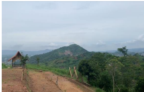
Gambar 5. Suasana di area Bumi Perkemahan (dokumentasi pribadi)

menjadi semacam undakan dengan batasan bambu dan pegangan bambu untuk memudahkan pendakian. Di area bumi perkemahan ini juga menjadi tempat penanaman pohon baru.