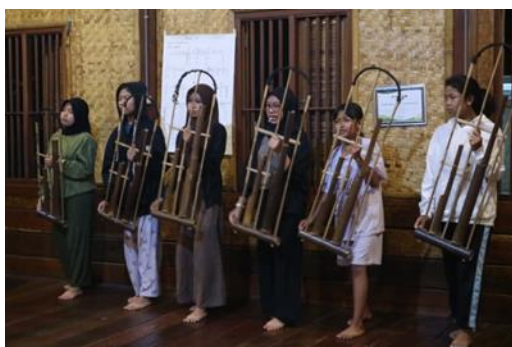
Gambar 3. Latihan Angklung Buncis

adat. Kelompok masyarakat adat di Kampung Cireundeu hingga kini masih mempercayai, melestarikan, melaksanakan, dan mewariskan adat istiadat dan kebudayaan masyarakat Sunda lama di sana, sementara masyarakat non-adat di kampung ini hidup selayaknya masyarakat Sunda secara umum. Dari aktivitas keseharian masyarakatnya dapat terlihat harmonisasi diantara kedua masyarakat tersebut, terbukti dengan gotong-royong yang sangat dijunjung tinggi oleh masyarakat Cireundeu. (3) Pola pangan yang unik. Seperti yang telah disinggung sebelumnya bahwa masyarakat di Kampung Cireundeu ini tidak mau ketergantungan pada beras sebagai makanan pokoknya tetapi menggantinya dengan sumber karbohidrat lain yaitu singkong. Singkong yang dikonsumsi diolah terlebih dahulu menjadi "rasi" atau beras singkong yang kemudian dimasak menjadi seperti nasi pada umumnya. Keunikan tersebut tentunya juga menjadi daya tarik utama yang dapat diamati oleh pengunjung. (4) Upacara adat dan kesenian tradisional. Apabila pengunjung beruntung berkunjung di hari-hari tertentu, pengunjung dapat menyaksikan upacara adat maupun kesenian tradisional yang rutin diadakan oleh masyarakat adat Cireundeu. Salah satu upacara yang secara rutin diselenggarakan yakni upacara Suraan atau upacara 1 Sura (1 Muharam) yang bermakna harmonisasi antara manusia dengan alam serta makhluk lainnya. Dalam kondisi pandemi sekarang, kegiatan ini yang paling dikurangi intensitasnya.