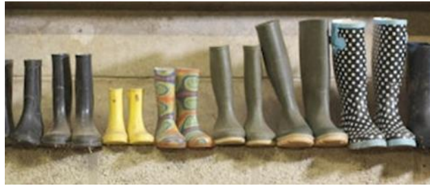
Gambar 1. Sepatu boot air dalam berbagai ukuran dan warna

Seiring meningkatnya kebutuhan dan variasi penggunaan sepatu boot air, industri manufaktur dituntut untuk meningkatkan kapasitas produksi tanpa mengorbankan mutu produk. Salah satu teknologi yang umum digunakan dalam proses pembuatan sepatu boot air adalah injection molding machine, khususnya tipe rotary dual injection, yang memungkinkan penggunaan dua jenis material atau warna dalam satu produk (Iqbal et al., 2021; Rahmadi et al., 2025; Wikipedia, 2022).